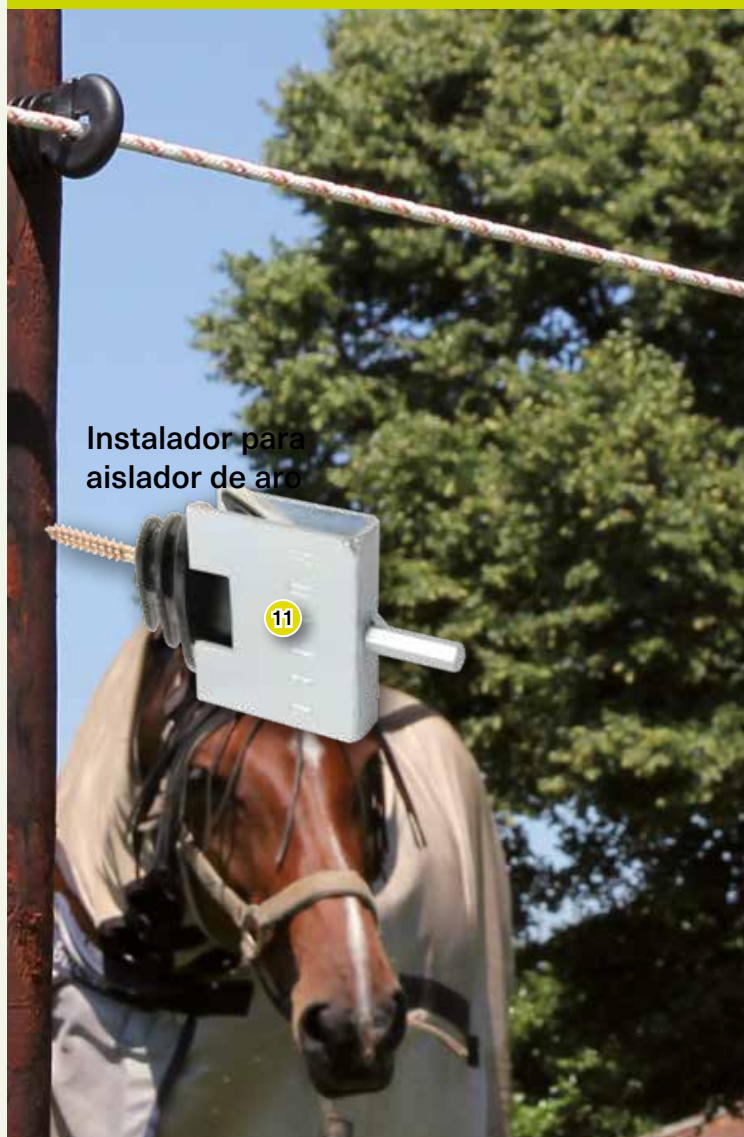
Instalador para aislador de aro